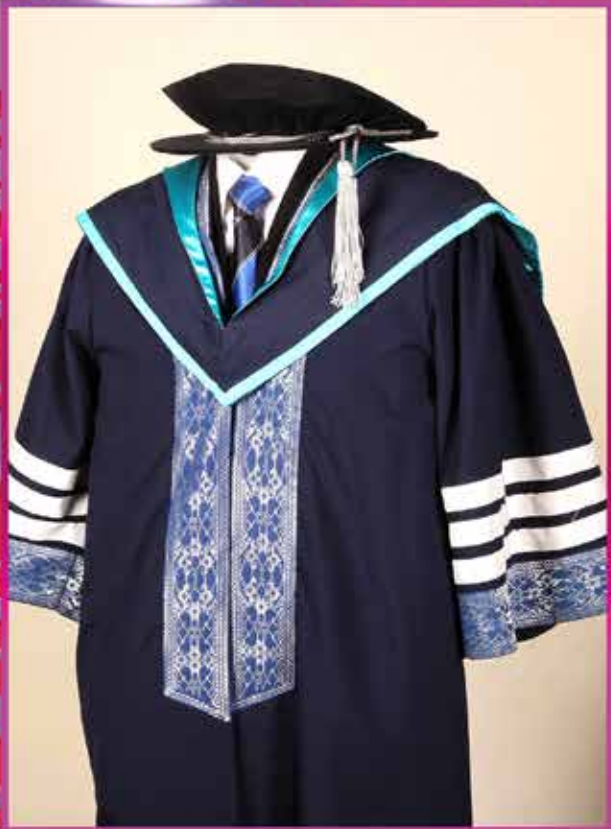
DOKTOR FALSAFAH DOCTOR OF PHILOSOPHY