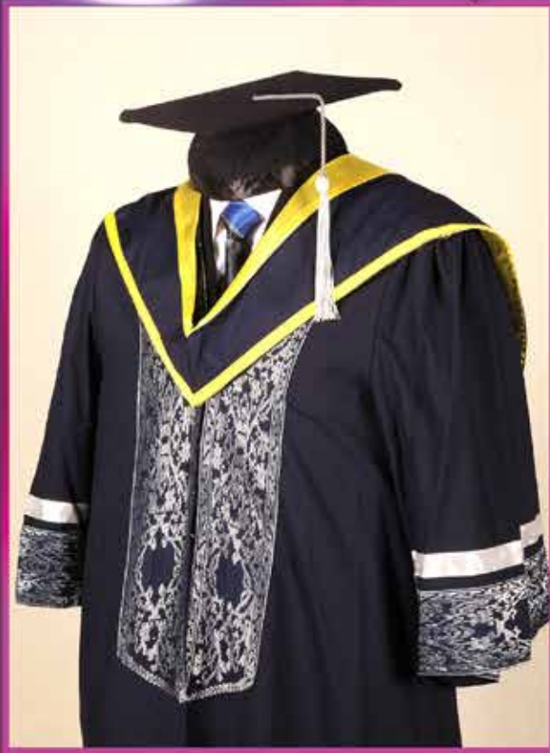
SARJANA MUDA BACHELOR DEGREE